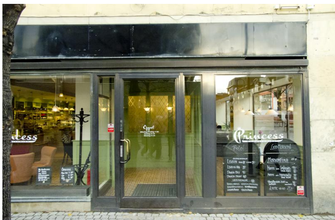
Café Princess i Sundbyberg centrum